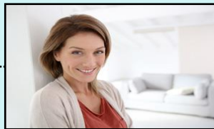
妈妈 māma 어머니