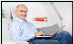
爷爷 yéye 할아버지