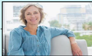
奶奶 nǎinai 할머니