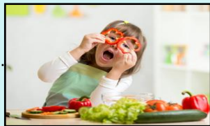
妹妹 mèimei 여동생