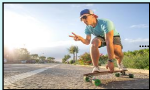
哥哥 gēge 오빠, 형