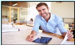
爸爸 bàba 아버지